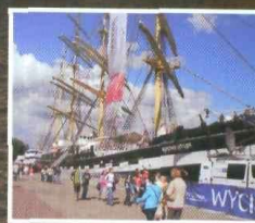
Dni Morza 2009 – s. 17