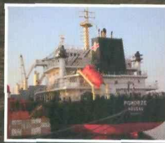
Transport morski 2009 – a kryzys – s. 6