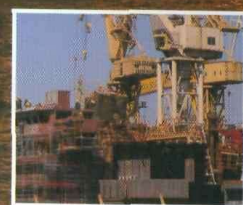
Stocznia sprzedana, nadzieja została – s. 8